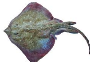
Raia da praia