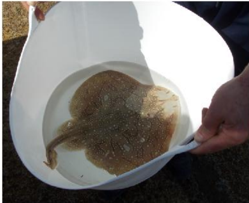
Raia mantida con vida ata a súa liberación nun capacho con auga de mar.]