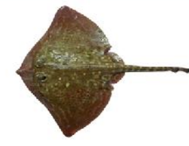
Raia de clavos

“Os peixes capturados e liberados poden morrer por varias causas, pero os motivos fundamentais son: as feridas, o tempo fora da auga e o estrés