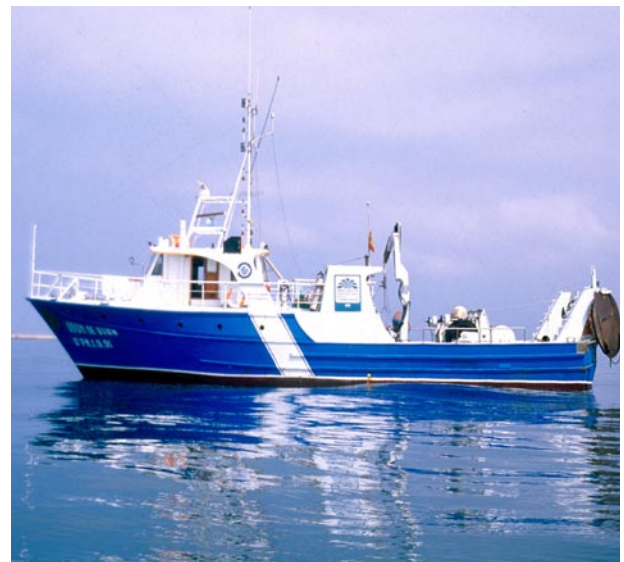
Figura 2. B/O Odón de Buen