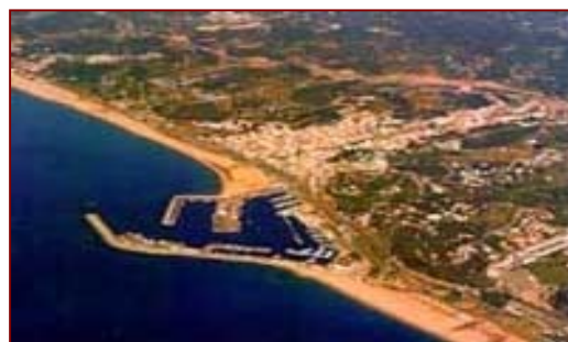
El puerto de Arenys de Mar en la costa catalana -donde las FAN de A. minutum son frecuentes- es un ejemplo de la intervención humana en la configuración de la línea de costa.

STRATEGY se propone realizar un modelo conceptual que explique la dinámica de las proliferaciones de Alexandrium en determinadas zonas creadas por las actividades humanas como puertos o playas. Se centrará en las siguientes áreas del Mediterráneo: litoral de Sicilia, islas Baleares, costa catalana, costa de Cerdeña y el litoral de Grecia. El desarrollo del modelo mencionado se basará en el estudio de los procesos físico-químicos y biológicos implicados en las FAN, realizando el consiguiente modelo físico de circulación, localización de zonas de convergencia y tasas de renovación, y por otro lado, el modelo biológico mediante el estudio de tasas de crecimiento de la fase planctónica y tasas de enquistamiento y germinación de los quistes de cada especie de dinoflagelado. En este sentido, después de un año y medio desde que comenzó el proyecto, se ha avanzado de forma importante en el conocimiento de las diferentes estrategias de vida de las distintas especies de Alexandrium y los factores que las determinan, lo cual es imprescindible para la comprensión de la dinámica de sus floraciones. Todo este conocimiento será muy útil a la hora de dilucidar si las floraciones de Alexandrium en el Mediterráneo son fenómenos costeros asociados con procesos oceanográficos de mayor escala como corrientes o frentes, o si por el contrario se restringen, en una menor escala, a