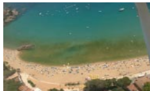
Proliferación de Alexandrium taylori en la playa de La Fosca (Cataluña).

El proyecto STRATEGY está coordinado por el equipo de fitoplancton tóxico del Instituto de Ciencias del Mar de Barcelona y participan en él además del equipo de fitoplancton tóxico del Centro Oceanográfico de Vigo, el equipo de oceanografía física del IMEDEA y la agencia FOA AMBIENTAL S.L. (ambas en Palma de Mallorca), la empresa CETIIS (Francia), el Centro Nacional de Investigación Marina de Grecia, la Universidad de Urbino (Italia), el Instituto Talasográfico de Mesina (Sicilia) y la Universidad de Sassari (Cerdeña).